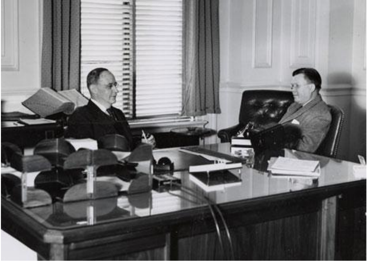
Фото. 2-й Архівіст США С. Дж. Бакк (зліва) та 3-й Архівіст США У. К. Гровер (з права), 20 травня 1948 р. [27]

З огляду на внесені пропозиції Комісія 12 квітня 1948 р. підписала угоду з Е. Ліхі та Національною радою з управління документацією про вивчення проблеми управління документацією у федеральному урядові. У звіті Ліхі від 14 жовтня 1948 р., представленому на розгляд Комісії, обсяг документів федеральних відомств був оцінений у 18,5 млн. куб. футів, а щорічні витрати на їх зберігання у 1,2 трлн. дол. Ліхі рекомендував створити Федеральну адміністрацію документації, інкорпорувати до її складу Національний архів та усі репозиторії, що зберігали непоточні документи федерального уряду, видати закон для регулювання процедур утворення, зберігання, управління і знищення документів, у кожному департаменті призначити особу, відповідальну за управління документацією, розробити і впровадити відповідні стандарти і правила.