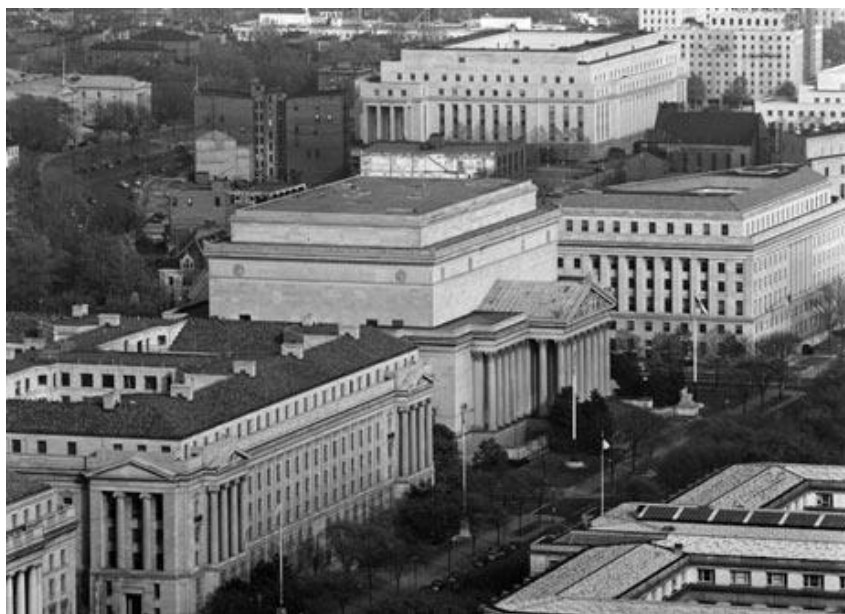
Фото Будинок Національного архіву (в центрі фото), 1951 р. [32].

У грудні 1949 р. у структурі NARS був створений Відділ з управління документацією (Records Management Division), 1950 р. Конгрес прийняв Закон про федеральні документи «Federal Records Act» (PL 754, 81 st Congress), у кожному федеральному відомстві були впроваджені програми управління документацією, згодом відкриті федеральні центри документації для зберігання не поточних документів федеральних агенцій. На 30 червня 1954 р. 95 % федеральних департаментів прозвітували про розроблення і впровадження конкретних переліків документів, утворюваних в їх відомствах зі строками зберігання і встановленими процедурами виділення нецінних документів до знищення [33].