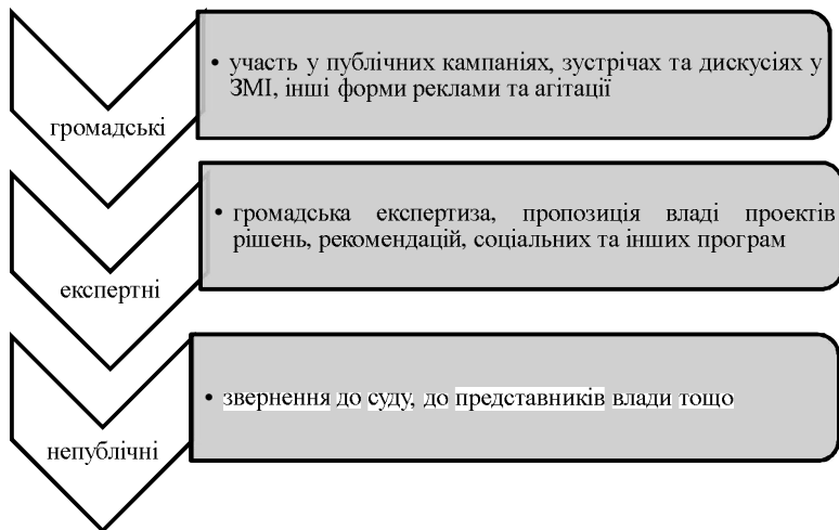
Рис.2. Основні форми громадської участі

своєму ставленні до влади [19]. Нині є велика кількість форм та інструментів участі громадськості у формуванні та реалізації державної політики. Форми громадської участі наведено на рис. 2.