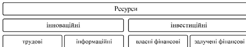
Рис. 1. Інноваційно-інвестиційні ресурси підприємств