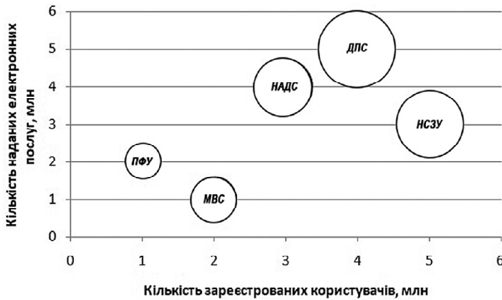
Рис. 3. Діаграма розміщення органів державного управління за рангами згідно з обраними показниками