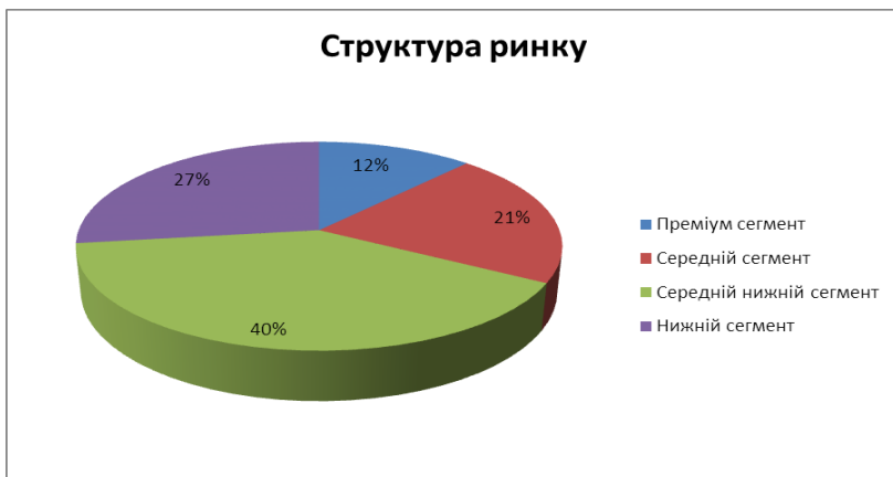
Рис. 3. Структура ринку