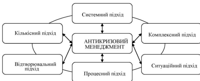
Рис. 1.3 Сукупність наукових підходів до випереджаючого антикризового управління

Назву рисунка друкують з великої літери та розміщують під ним посередині рядка, наприклад: