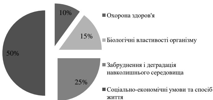
Рис. 1. Роль зовнішніх та внутрішніх чинників у формуванні громадського здоров'я

Умови, обставини, конкретні причини, більше за інших відповідальні за якість громадського здоров'я, за виникнення та розвиток хвороб отримали назву «факторів ризику». Незважаючи на те, що наука, техніка, санітарна інфраструктура сприяли створенню так званої «броні цивілізації», яка повинна захистити людину від негативних впливів навколишнього середовища, все одно залишилися фактори біологічних властивостей окремих індивідів, різних компонентів довкілля та їх сукупність, які в певній мірі надають негативний вплив на розвиток громадського здоров'я в цілому (рис. 1).