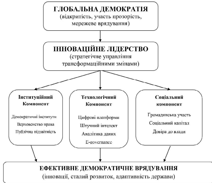
Рис. 3. Концептуальна модель взаємодії глобальної демократії та інноваційного лідерства