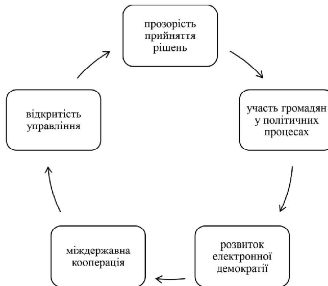
Рис. 1. Основні характеристики глобальної демократії