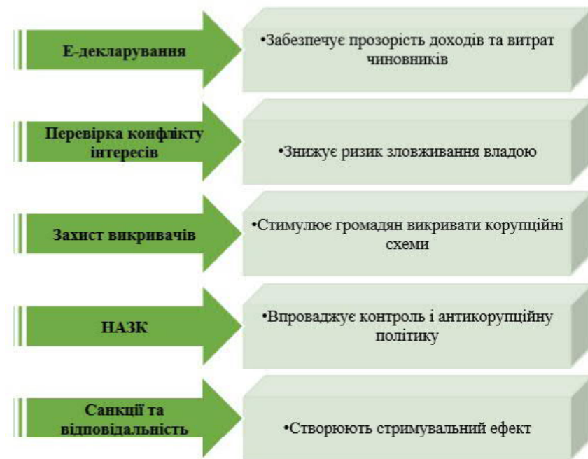
Рис. 3. Механізми боротьби з корупцією відповідно до Закону України «Про запобігання корупції».

Безпосередньо Закон України «Про запобігання корупції» уніфікував антикорупційне законодавство та створив правове підґрунтя для оновленого інституційного механізму боротьби з корупцією, забезпечивши тим самим відповідність стандартам ЄС і GRECO; «відкрив» шлях до антикорупційної реформи в Україні та став основою для створення електронної системи декларування, на що вже чекали багато років українське суспільство, особливо після злочинного режиму Януковича та його поплічників (рис. 3).