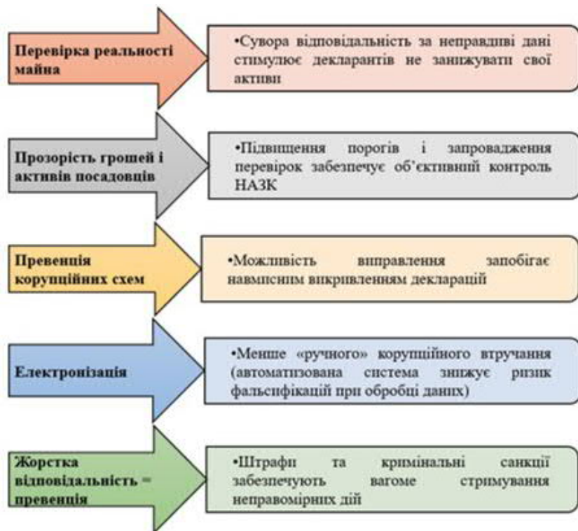
Рис. 4. Ключові аспекти Закону України № 1022-VIII щодо подолання корупції в Україні.

повідомлень, створити централізовану платформу (Єдиний портал повідомлень викривачів), посилити права викривачів та відповідальність за їх порушення, закласти основу для подальшого розвитку системи захисту викривачів в Україні [5].