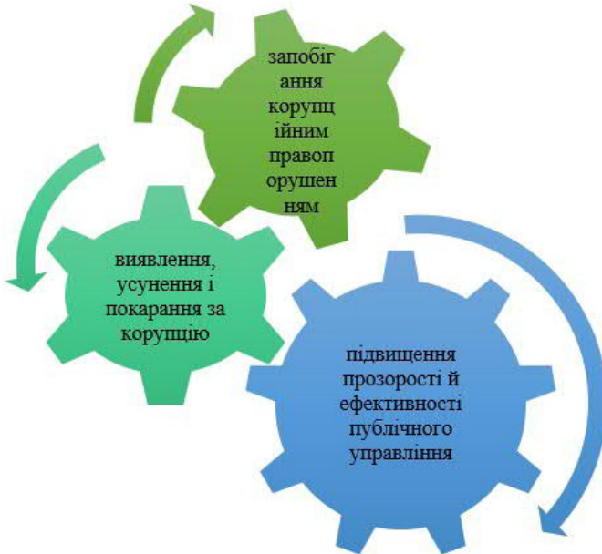
Рис. 2. Мета Закону України «Про запобігання корупції».

Мета вказаного Закону полягає у створенні правових та інституційних механізмів так званої превентивної антикорупційної системи для: