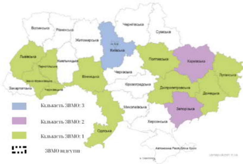
Рис. 2. Карта-схема кількісного розподілу закладів вищої медичної освіти України.

медичною освітою, підготовкою менеджерів сфери охорони здоров'я та безпосередньо керівних кадрів закладів вищої медичної освіти удосконалення управління сферою охорони здоров'я на всіх рівнях означає модернізацію інфраструктури, опрацювання системи визначення пріоритетів, аналіз і обґрунтування політики в галузі медичного забезпечення, об'єктивність і справедливність при розподілі ресурсів, формуванні адекватного бюджету, підвищення кваліфікації та рівня професійної компетенції менеджерів сфери охорони здоров'я, і зокрема керівників закладів вищої медичної освіти [5, с. 43]. Просторовий аналіз розміщення закладів вищої медичної освіти свідчить про певну диспропорційність та концентрацію в областях з високим показником кількості населення та кількості медичних установ (рис. 2).