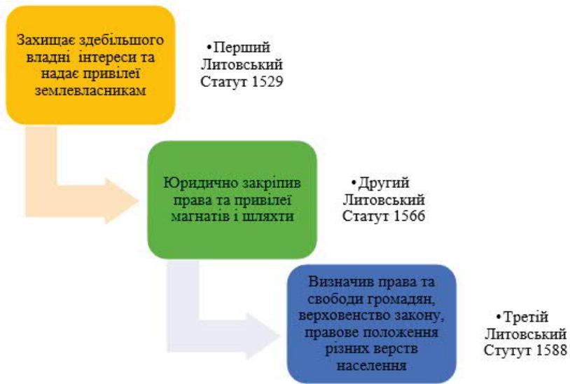
Рис.1. Характеристика Литовських статутів, як правових джерел та їх значення.