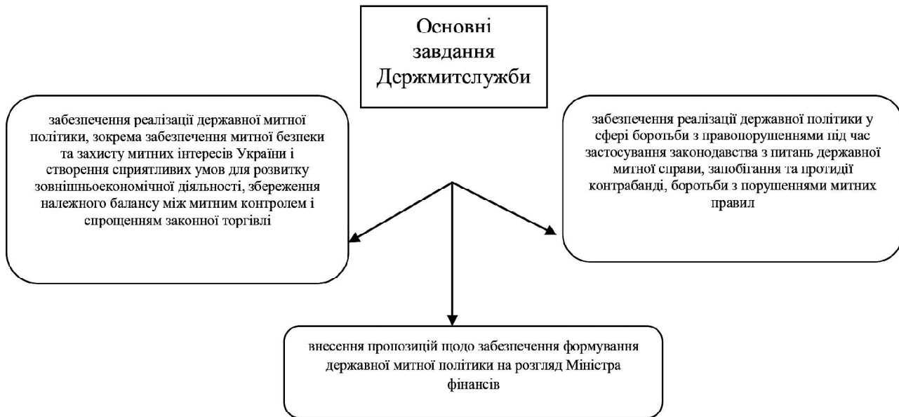
Рис.2. Основні завданнями Держмитслужби