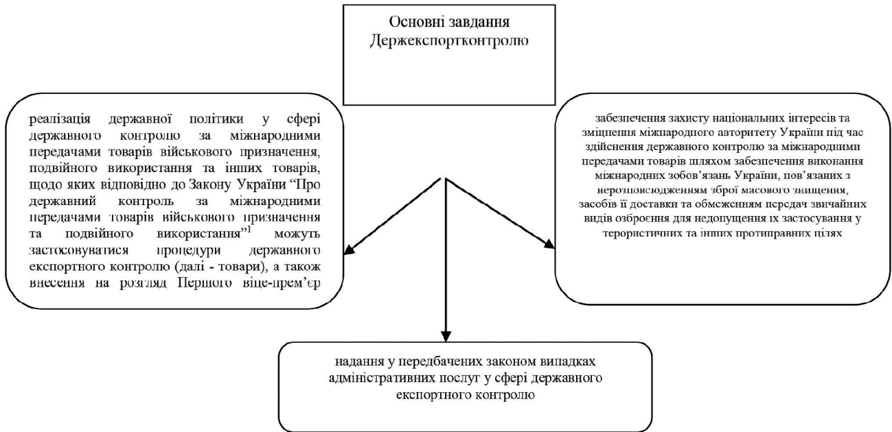
Рис.4. Основні завданнями Держекспортконтролю