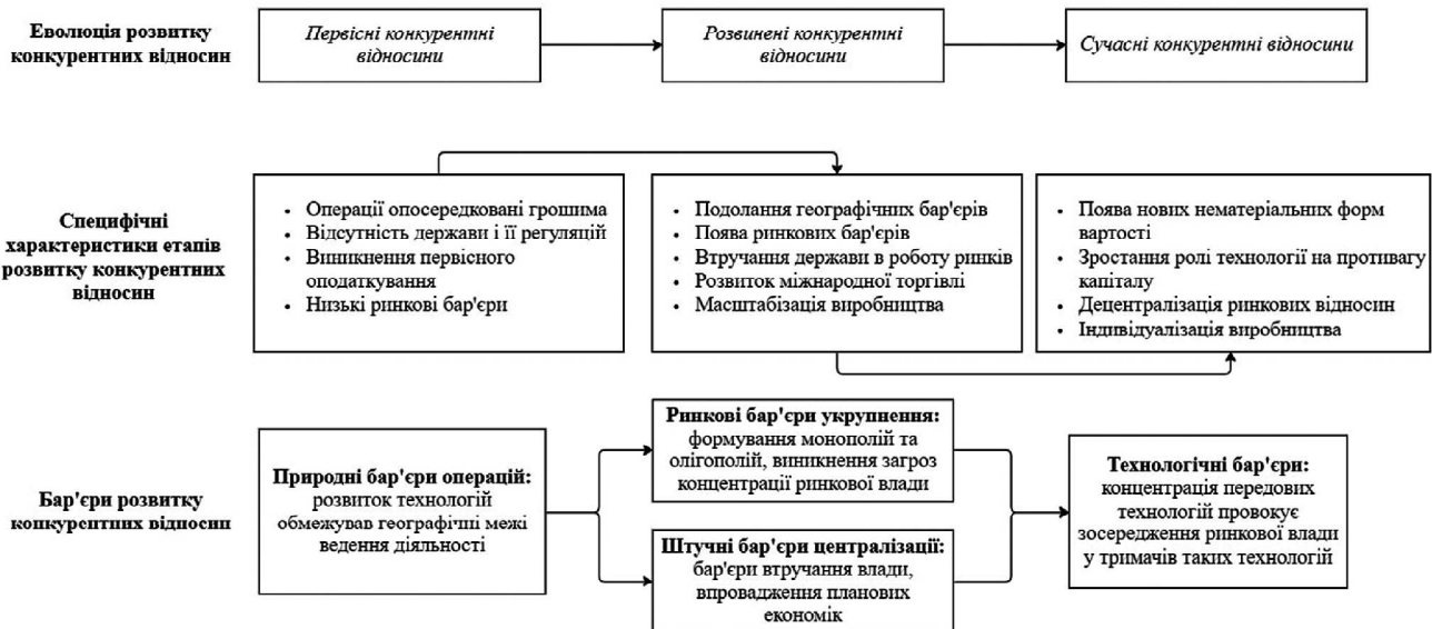
Рис. 2. Еволюція розвитку конкурентних відносин