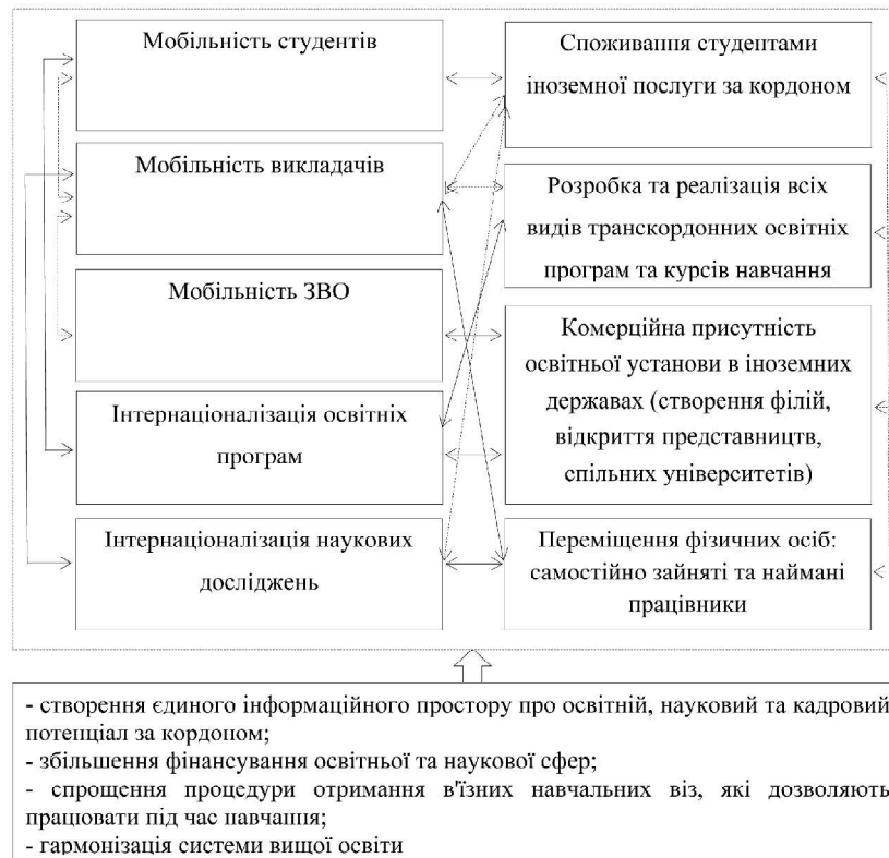
Рис. 1. Схема експорту вищої освіти через його інтернаціоналізацію

Інтернаціоналізація освітніх програм передбачає комплекс заходів, вкладених у реалізацію принципу вільного переміщення осіб у рамках європейського економічного простору, зазначеного у Римському договорі. Ця форма реалізується у вигляді здійснення мобільності всіх учасників науково-освітнього процесу, освітніх програм, постачальників освітніх послуг, а також виконання спільних академічних проєктів.