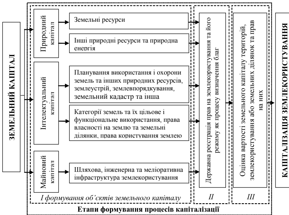
Рис. 1. Логічна модель структури методології формування земельного капіталу та етапів формування процесів капіталізації