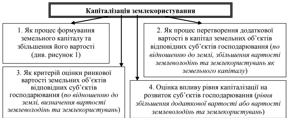
Рис. 2. Методологічний підхід до дослідження капіталізації землекористування

Таким чином, капіталізацію землекористування необхідно розглядати у таких аспектах: по-перше це процес здійснення територіально-просторового планування землекористування, землеустрою та землевпорядкування як земельних поліпшень та складової формування земельного капіталу; по-друге це процес державної реєстрації прав власності на землекористування та його режиму як визначення видів благ; по-третє це процес оцінювання вартості землекористування (земельних ділянок та прав на них) як земельного капіталу, що продукується внаслідок використання або невикористання землі, з метою перетворення ресурсу на актив, привабливий для інвестицій. Крім того, четвертим аспектом капіталізації землекористування є збільшення (нарощення) такої вартості на відповідному землекористуванні. Нарощування вартості земельного капіталу здійснюється в залежності від те-