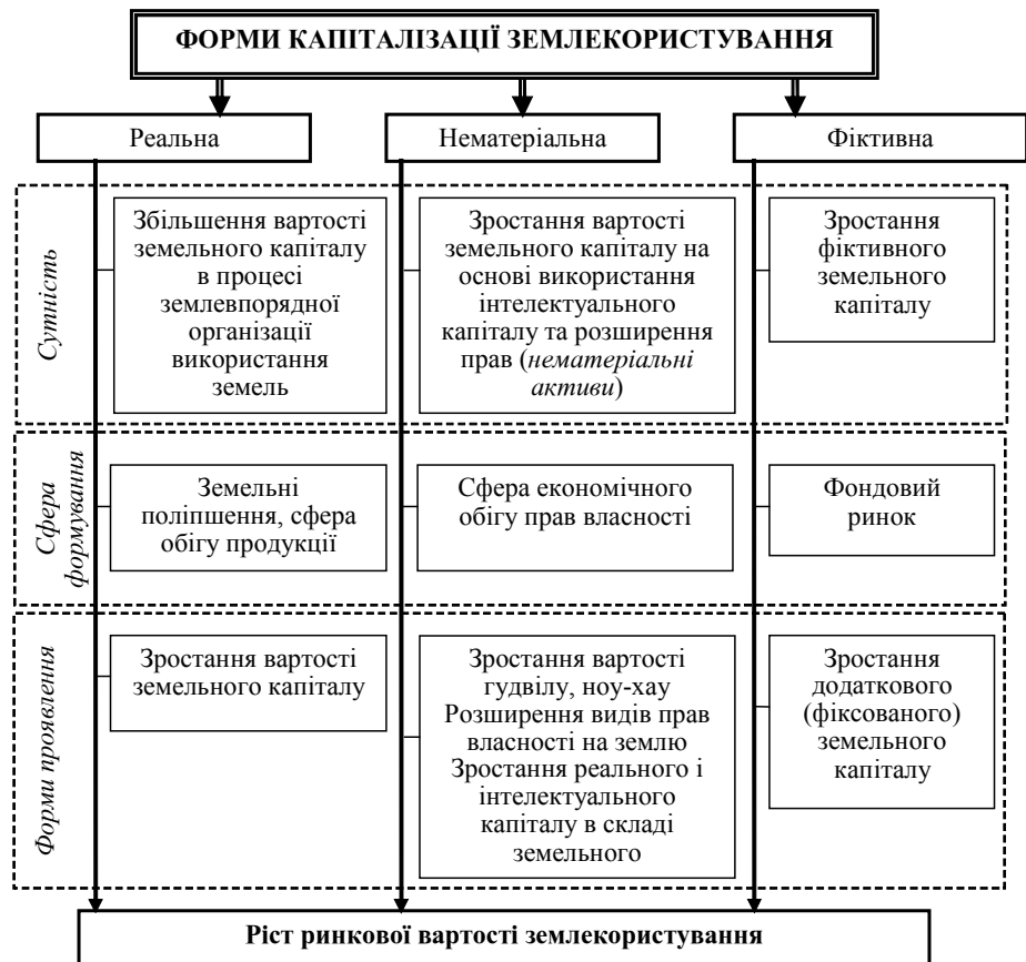
Рис. 4. Форм капіталізації землекористування

В процесі дослідження поняття та сутність капіталізації землекористування в Україні та його форми, встановлено, що капіталізація землекористування — це процес формування та зростання вартості земельного капіталу і створення доданої вартості від організації використання земель та інших природних ресурсів і прав на них, здійснення земельних поліпшень, обігу земельних ділянок або їх сукупності як землекористування та прав на них. Сутність