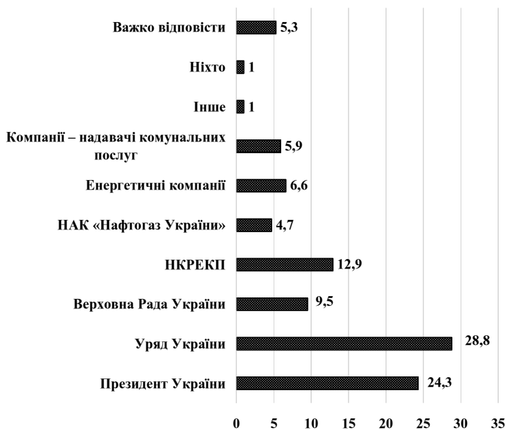
Рис. 2. Розподіл думок щодо основної відповідальності за зростання комунальних тарифів, %