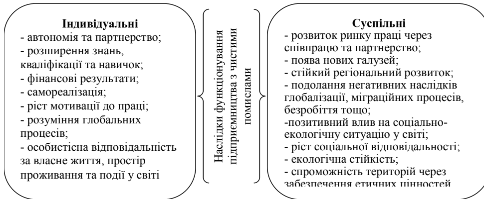
Рис. 1. Наслідки функціонування сталого підприємництва

лізації, збереженні та примноженні психологічних, соціальних, економічних та екологічних можливостей для майбутніх поколінь, створення цінностей, спроможних забезпечити економічне процвітання, соціальну згуртованість та захист навколишнього середовища (рис. 1).