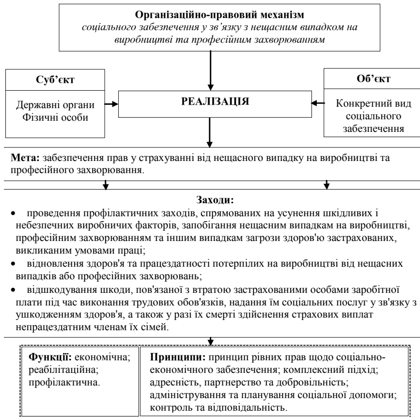
Рис. 3. Організаційно-правовий механізм соціального забезпечення у зв'язку з нещасним випадком на виробництві та професійним захворюванням

страхування" від 23.09.1999 р. визначено правову основу, економічний механізм та організаційну структуру загальнообов'язкового державного соціального стра-