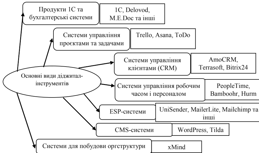
Рис. 2. Основні види діджитал-інструментів сучасного бізнесу