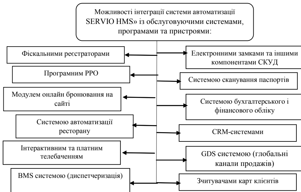
Рис. 4. Схема можливостей інтеграції програмних продуктів типу "SERVIO HMS" із зовнішніми обслуговуючими системами, програмами та пристроями