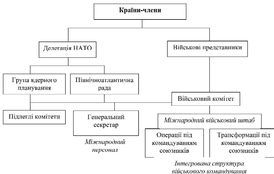
Рис. 1. Структура НАТО

Джерело: власна розробка автора на основі [8].