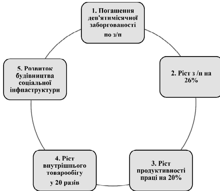
Рис. 1. Переваги застосування гезелівських грошей ТТ (товарних талонів) у м. Вергель Австрія у 1931–1933 рр.