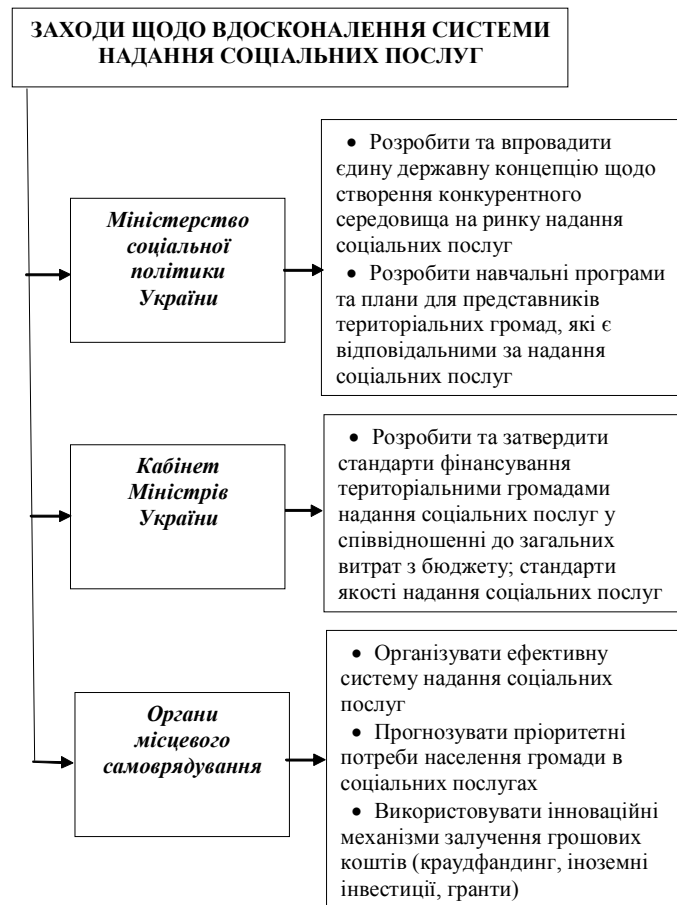
Рис. 2. Заходи щодо вдосконалення системи надання соціальних послуг