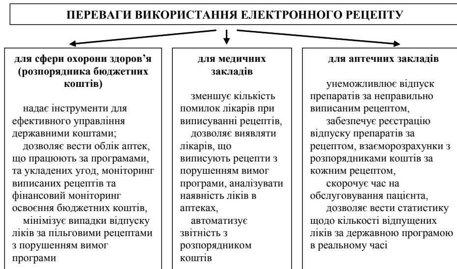
Рис. 3. Переваги використання електронного рецепту в сфері охорони здоров'я

Захист персональних даних пацієнтів — головна проблема впровадження ЕМК. Електронні записи про здоров'я у розвинених країнах формують не тільки медичну картку. Їх можна переглянути в персональному кабінеті користувача послуг [12].