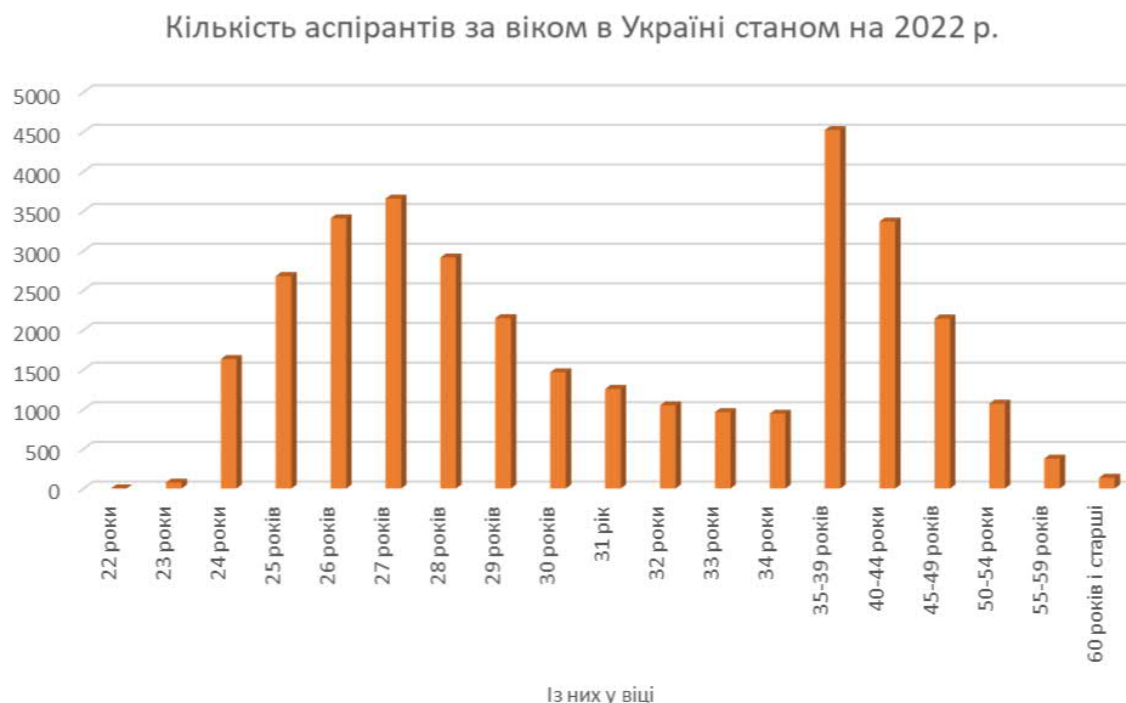
Рис. 1. Зміна кількісних показників здобувачів третього освітньо-наукового рівня у відповідності до вікового показника

необхідний. Одним з шляхів залучення частини економічно-активного населення для подальшого розвитку власного наукового потенціалу є застосування дуальної форми здобуття вищої освіти та завершення навчання в межах аспірантури (рис. 1). Як зазначають сучасні демографи, зокрема Л. Заставецька, І. Костащук, для виходу з демографічної кризи для України в повоєнний період необхідно буде реалізувати низку заходів, зокрема серед них запровадження соціальної підтримки молодих сімей (молодих вчених), розробки програм житлового кредитування, допомога з працевлаштуванням після здобуття вищої освіти [7, с.98–101].