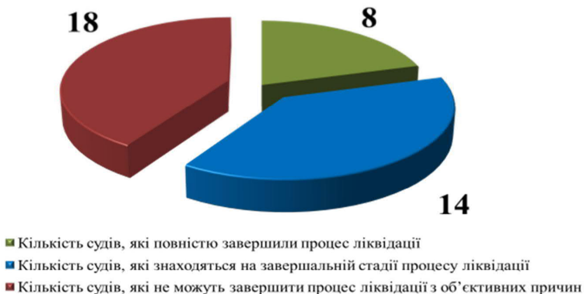
Рис.1. Ліквідація апеляційних судів (2019 рік)

8 апеляційних судів у Вінницькій, Житомирській, Івано-Франківській, Кіровоградській, Сумській, Тернопільській, Чернівецькій областях та Житомирський апеляційний адміністративний суд [13].