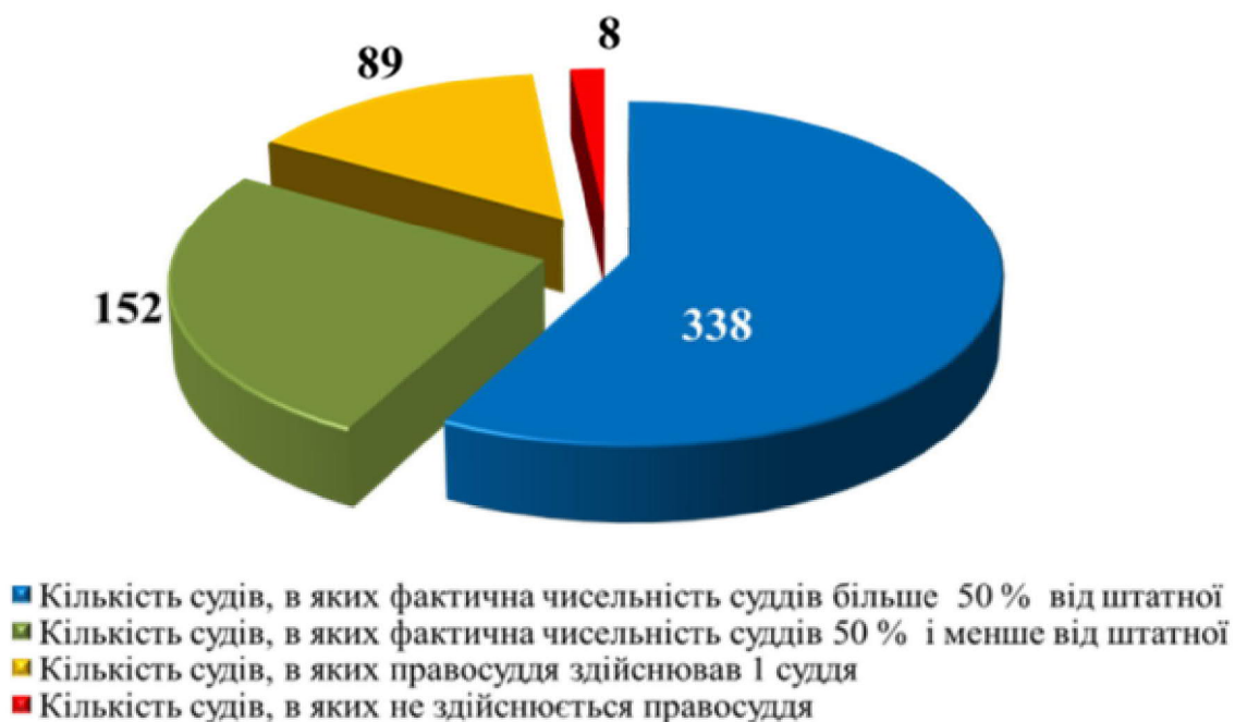
Рис.3. Укомплектованість місцевих загальних судів (2020 р.)