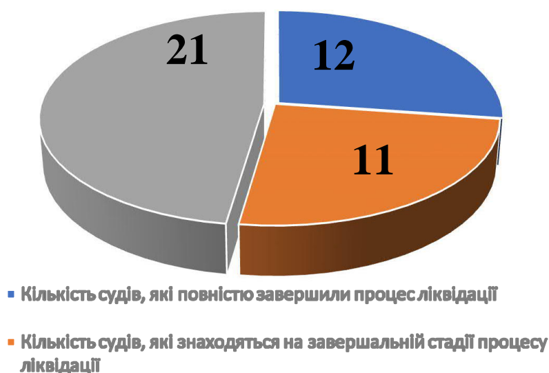
Рис 2. Інформація про стан процесу ліквідації апеляційних судів Джерело: [14]

Протягом 2020 року ліквідаційні комісії, які утворені ДСА України, продовжували виконувати заходи щодо ліквідації. У 2020 році повністю завершили процедуру ліквідації п'ять судів Вінницької, Львівської та Хмельницької областей, Дніпропетровський та Одеський апеляційні господарські суди [14].