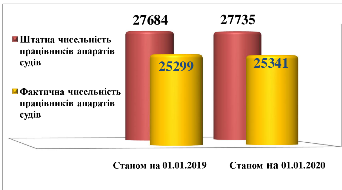
Рис.4. Чисельність працівників апаратів місцевих, апеляційних судів (2019-2020 роки)