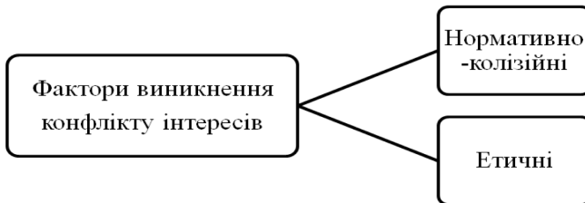
Рис. 1. Передумови та мотиви виникнення конфлікту інтересів.

Передумови та мотиви виникнення конфлікту інтересів в системі державного управління та місцевого самоврядування можна виокремити в групи факторів (рис. 1).