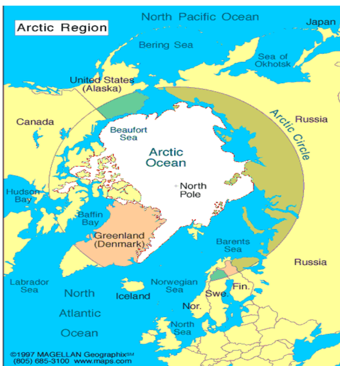
Мал. 1 Арктичний регіон.

До цього регіону входить лише вісім узбережних держав (Мал. 1), які мають території за Північним полярним колом (Данія з Гренландією і Фарерськими островами, Ісландія, Канада, США, Норвегія, Фінляндія, Швеція та Російська Федерація), п'ять з яких безпосередньо виходять до Північно-Льодовитого океану, але водночас арктичний регіон є місцем концентрації інтересів багатьох неарктичних країн світу з огляду на можливості, які в умовах глобального потепління стають все більш доступними – судноплавства, рибальства, видобутку вуглеводнів та багатьох корисних копалин.