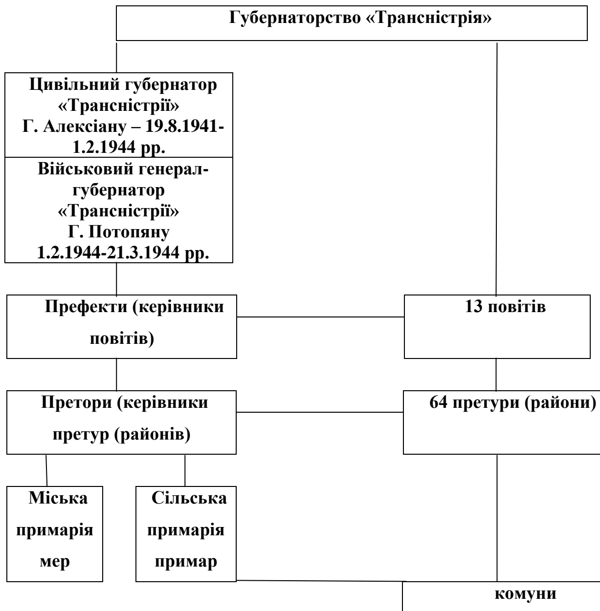
Схема складена на основі джерел та літератури [227, арк. 1-30; 386, с. 24; 390, с. 41]