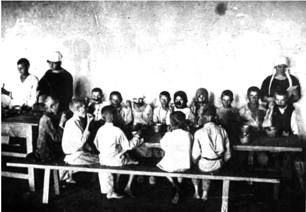
Розподіл супу дітям в одному із притулків за рахунок продуктів «Місії Нансена»