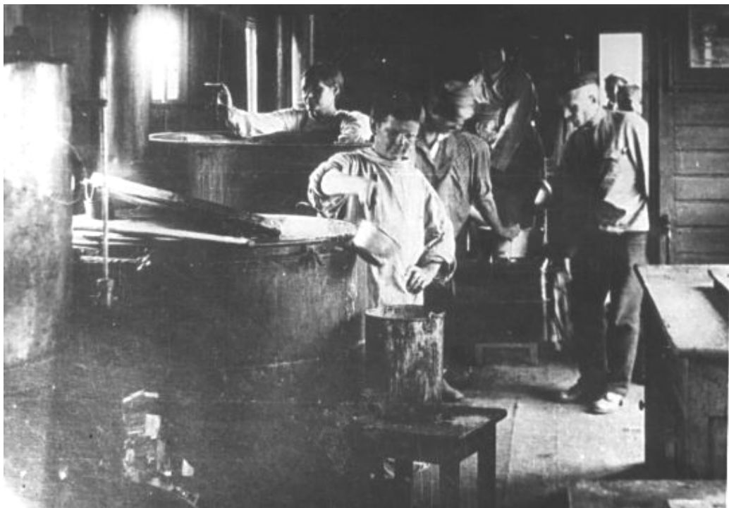
Робота кухні на одній із їдалень «Місії Нансена», 1922 р.