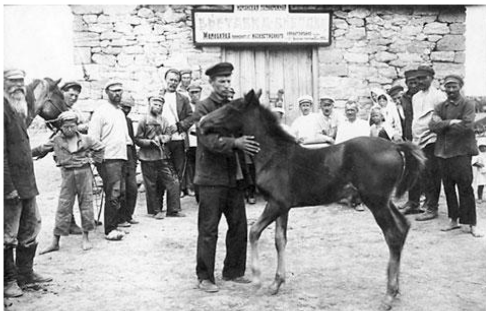
Єврейські колоністи з кіньми від Джойнта. Колонія Ефінгар. 1920-і рр.