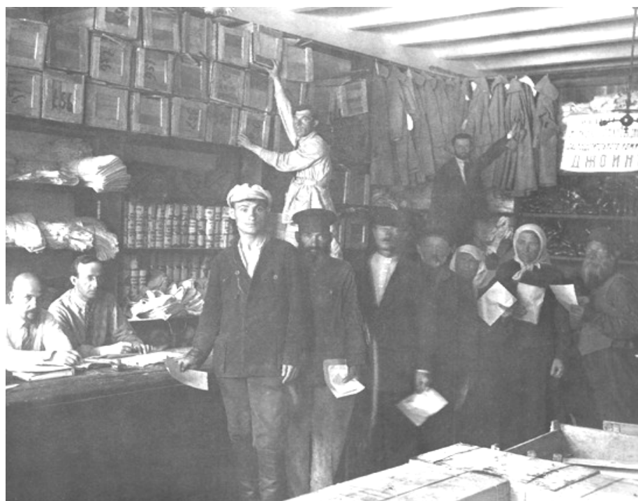
Видача посилок Джойнт. 1922 рік.