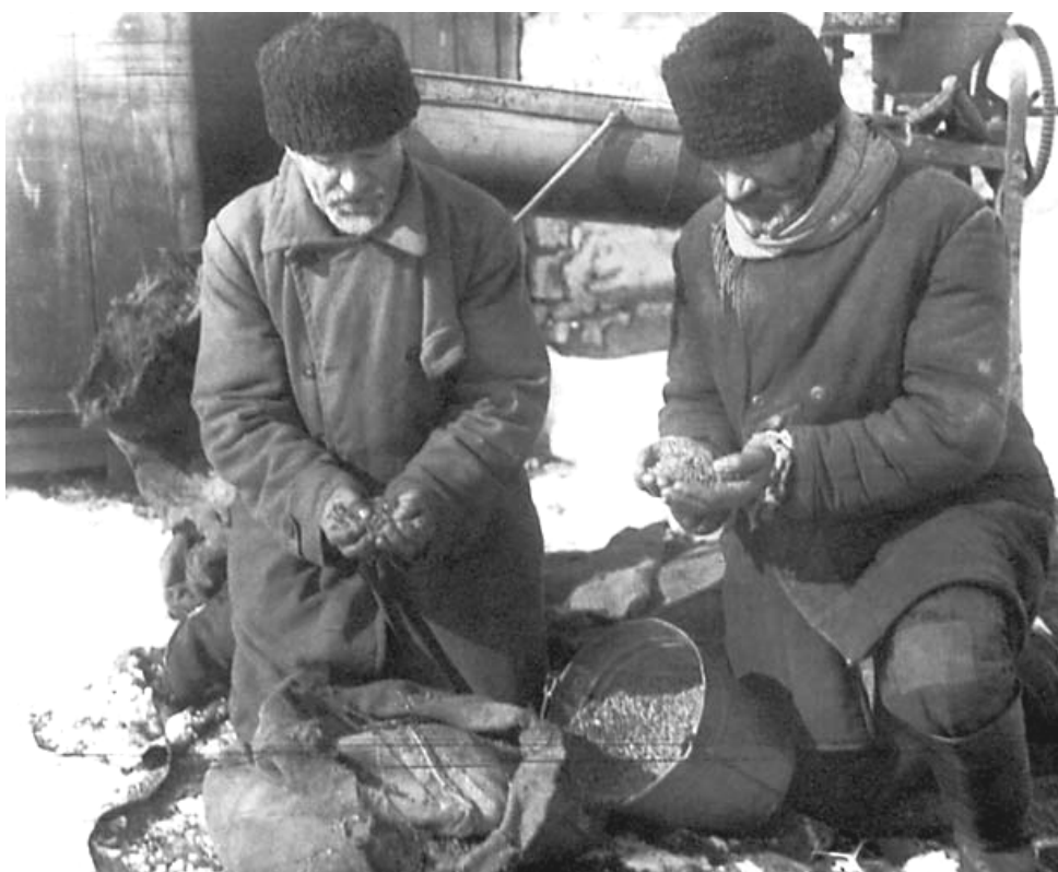
Колгоспники єврейського колгоспу «Путь до соціалізму» Калініндорфського району. 1932.