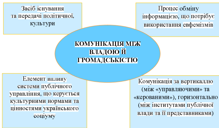
Рис. 1. Модель комунікації між владою й громадськістю.

Однак, на нашу думку, комунікацію між владою й громадськістю можна уявити як безперервний процес обміну інформацією, взаємовпливу влади й громадськості в системі публічного управління, як вертикально так і горизонтально, на основі культурних норм та цінностей, що діють в українському соціумі (зокрема через коректну ввічливу поведінку за допомогою використання евфемізмів) (Рис. 1).