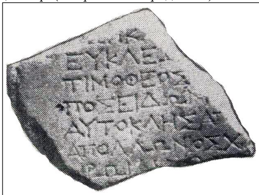
Рис. 2. Фото мармурової плити

А так виглядає апокрифологічний переклад цього напису-молитви батька Трофіма-Мідаса, Аполлоніда Нікійського до власного 85 р.: «Господи, помилуй раба твого Аполлоніда Нікійського зі супутницею Кірою з 7-ма дітьми. Спаси моїх й пом'яни усіх разом із святыми в 55 д. 350 р. (8 вересня 426 р. до н. е.) Во гніві не