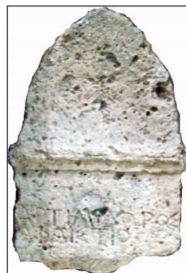
Рис. 3. Вапнякова стела

Нещодавно, (ΑΑ) 11 р. тому, Гефест нар. в (Αρτ) 85 д. (τιμί) 306 р. подарував мені в (ιδ) 30 р. оберіг тасмний в (δω) 50 д. (ωΑφα) 377 р. – нар. в (φ) 50 д. (φα) 347 р. в (στ) 50 д. (λοος) 388 р.